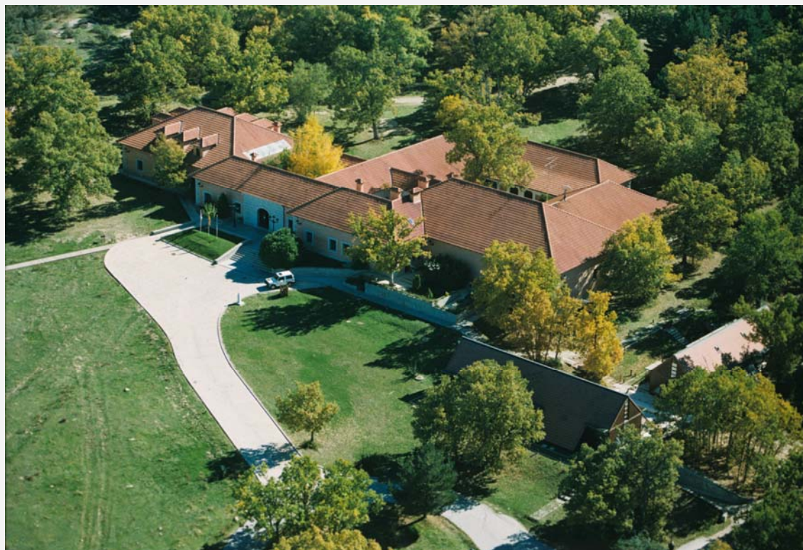
Centro Nacional de Educación Ambiental. CENEAM